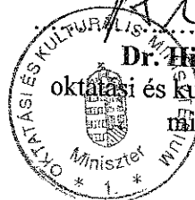
Dr. Hiller István oktatási és kulturális miniszter