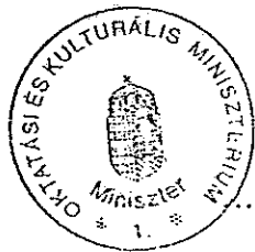
Dr. Hiller István oktatási és kulturális miniszter