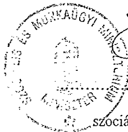
Kiss Péter szociális és munkaügyi miniszter